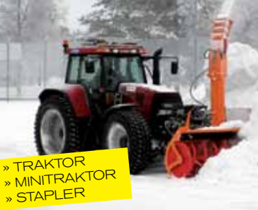
» TRAKTOR » MINITRAKTOR » STAPLER