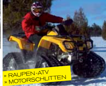
» RAUPEN-ATV » MOTORSCHLITTEN