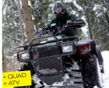
» QUAD » ATV