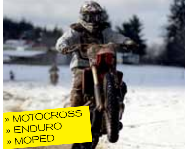
» MOTOCROSS » ENDURO » MOPED