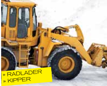
» RADLADER » KIPPER